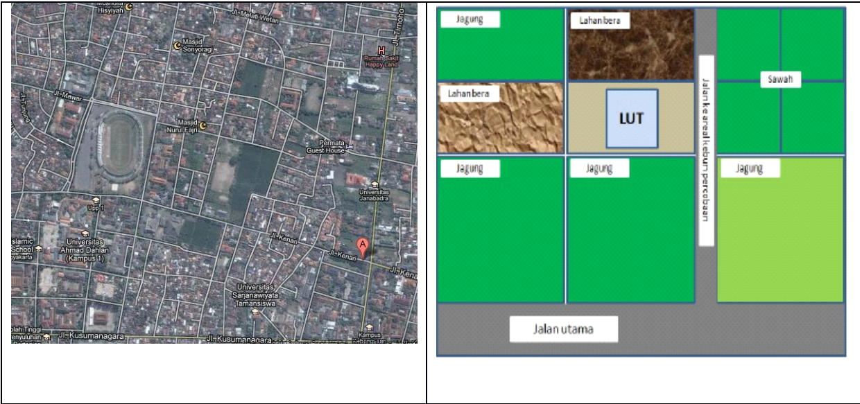
Gambar 2. Contoh Peta LUT dan ekosistem sekitar