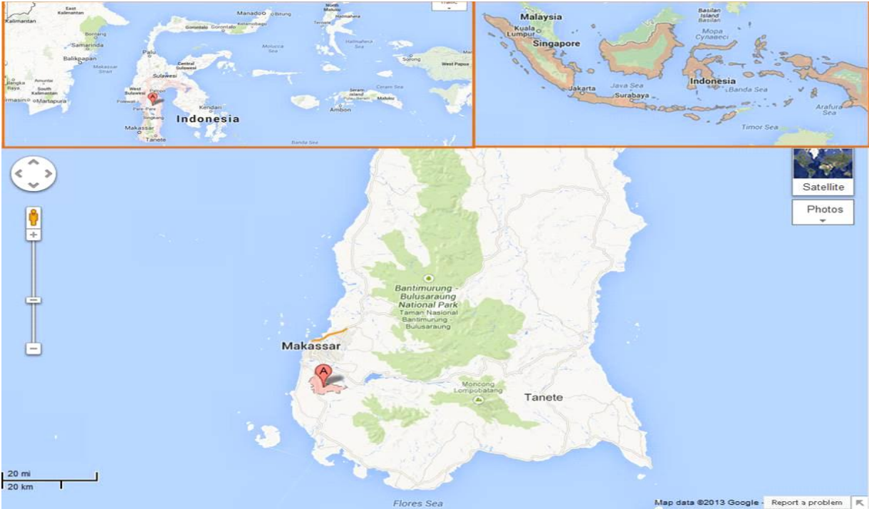
Gambar 1. Contoh Peta Lokasi Geografis LUT (alamat dan titik koordinat)